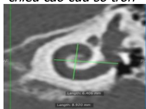
c. Đo chiều cao và đường kính ngang ốc tai