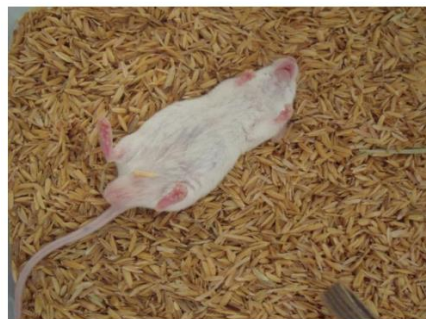
Hình 2.1 Chuột ở trạng thái ngủ khi mất phản xạ thăng bằng

Chỉ tiêu đánh giá: Chuột được coi là ngủ khi mất phản xạ thăng bằng, ghi nhận thời gian ngủ được tính từ lúc chuột mất phản xạ thăng bằng đến khi phục hồi phản xạ này [10].